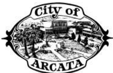
Illustration and Design: Oscar J. Arzate

Provided by the City of Arcata Stormwater Education Program For More Information (707) 822-8184 www.cityofarcata.org